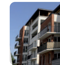
Marçq-en Barœul Résidence Lespierre 14, Rue Philippe Noiret 18 logements en accession