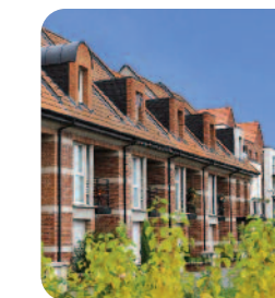
Le Bizet Résidence Les Portes de France Avenue Léon Blum 91 logements en location

C'est dans le cadre d'un engagement social pérenne et responsable que le groupe Ldev fait évoluer son offre de logements diversifiée, visant à satisfaire les personnes à revenus modestes, les personnes âgées, les personnes à mobilité réduite ainsi que les étudiants.