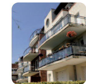
Dunkerque Résidence Chantiers de France 35, Rue des Terres-Neuves 25 logements en location